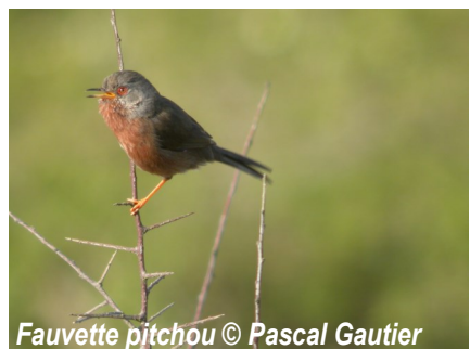
Fauvette pitchou

2023 à juillet 2026. Pendant ces trois années seront menés sur le territoire des inventaires de la faune, de la flore et des habitats naturels , en s'entourant d'experts naturalistes (Bretagne Vivante, Groupe d'Etude des Invertébrés Armoricaux, ...).