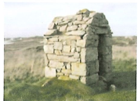
Fondations de la guérite - 1 - 2 - 3 Guérite de la batterie de l'île de Sieck (Santec) - 4

1781 : la guérite est en maçonnerie et a été faite en 1779.